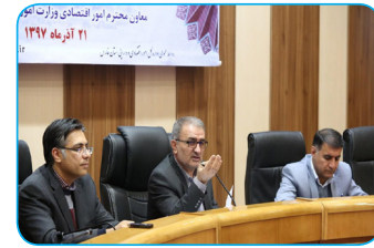
معاون محترم امور اقتصادی و سرمایه گذاری استان فارس در جلسه

آیین رونمایی از پیشخوان مجوزهای کشور با حضور سرپرست استانداری فارس و معاون امور اقتصادی و دارایی برگزار شد. به گزارش پایگاه اطلاع رسانی استانداری فارس، پیشخوان مجوزهای کشور با حضور مهندس یداله رحمانی، سرپرست استانداری فارس و دکتر سید حسین میرشجاعیان حسینی، معاون امور اقتصادی وزارت اقتصاد و دارایی در استان فارس رونمایی شد.