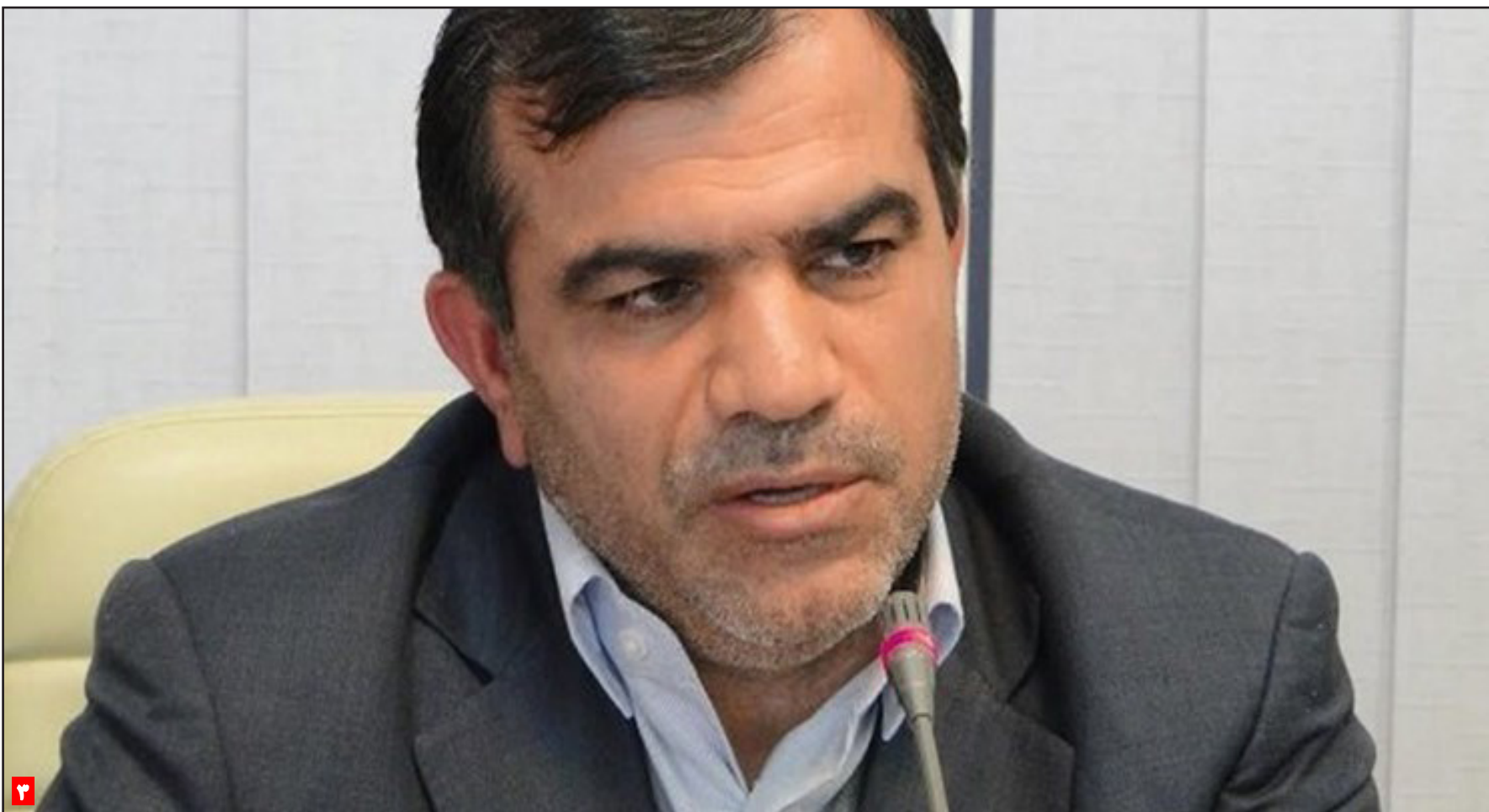
معاون توسعه روستایی و مناطق محروم:

پر تیراژ ترین هفته نامه در شهرستانهای لامرد و مهر