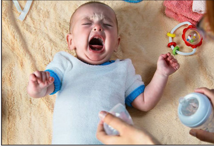
سبک زندگی آشفته

همیشه در گوشه‌ی ذهن‌تان باشد تا هر وقت حتی کوچک‌ترین فرصتی برای این کار پیدا شد از آن غافل نمانید. در گفتگوهای‌تان نیازهای‌تان را مطرح کنید، ابراز محبت کنید، سرزنش نکنید، تشکر کنید و ... یک ارتباط باز و شفاف و صمیمی همیشه مهم است، اما زمانی که در حال سازگاری پیدا کردن با شرایط جدید هستید، مهم‌تر هم می‌شود.