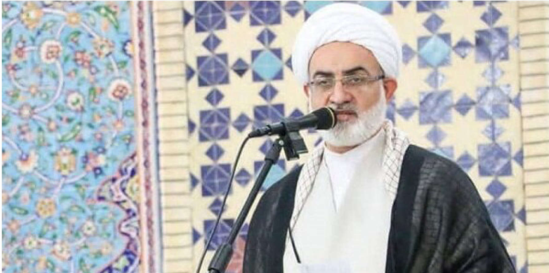
امام جمعه لامرد تاکید کرد:

دوشنبه ۶ تیر ماه ۱۴۰۱ - سال ششم - شماره ۲۰۵ - بها ۵۰۰۰ تومان