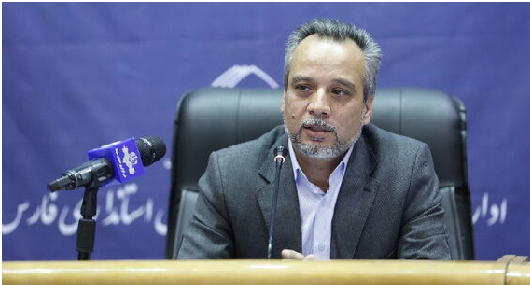
معاون استاندار فارس:

چهارشنبه ۵ مرداد ماه ۱۴۰۱ - سال ششم - شماره ۲۰۷ - بها ۵۰۰۰ تومان