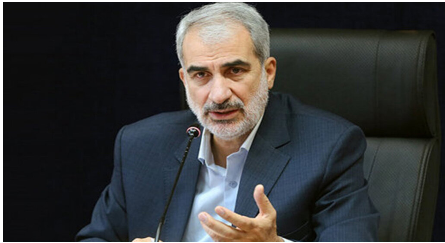
وزیر آموزش و پرورش:

پنجشنبه ۱۵ دی ماه ۱۴۰۱ - سال ششم - شماره ۲۱۹ - بها ۵۰۰۰ تومان