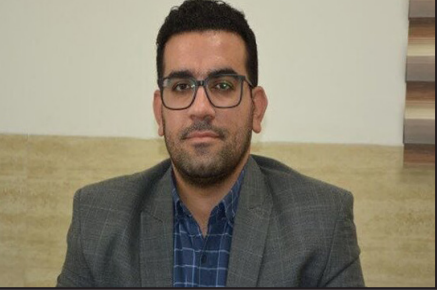
رئیس شبکه بهداشت و درمان لامرد گفت: دفتر پیشخوان خدمات سلامت برای اولین بار در شهرستان‌های جنوبی استان فارس، در لامرد راه اندازی می‌شود.

ادامه داده تا با توکل بر خداوند زمینه پیروزی‌های جدیدی را برای نظام مقدس جمهوری اسلامی ایجاد کنیم. وی ادامه داد: شهید مزده در زمان جنگ افراد زیادی را تحت تأثیر قرار داده بود و موجب شد افراد زیادی برای رفتن به جبهه تشویق شوند، نباید فراموش کرد که آرامشی که اکنون در کشور وجود دارد حاصل خون شهدا و ایثار آنان است. آیت الله علوی گفت: زمانی که دشمن جنگ را بر ما تحمیل کردند، تجهیزات و ادوات نظامی ما در حدی نبود که وارد جنگ تمام عیار با دشمن تا بن دندان مسلح شویم اما نباید فراموش کرد که وجود سلاح در کنار فرهنگ شهادت باعث پیروزی ایران اسلامی در مقابل دشمنان شده است. آیت الله علوی افزود: دشمن به کشورهای سوریه، عراق، لبنان، افغانستان و... حمله می‌کند اما این توان حمله به ایران را نداشته زیرا کشور در