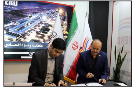
در حاشیه برگزاری نمایشگاه «حمایت از ساخت داخل در صنعت پتروشیمی» و در راستای افق نهایی منطقه ویژه اقتصادی لامرد، قرارداد ساخت دو طرح پتروشیمی با تولید سالیانه پنج میلیون

تن انواع محصولات در این منطقه منعقد شد. به گزارش خبرنگاری صداوسیما: تولید سالیانه پنج میلیون تن انواع محصولات پتروشیمی در افق نهایی منطقه ویژه اقتصادی لامرد در نظر گرفته شده است به همین منظور ۴۰۰ هکتار از زمین‌های این کانون صنعتی برای ساخت مراکز پتروشیمی اختصاص یافته است. به این منظور، دو طرح پتروشیمی عظیم یعنی سرمایه‌گذاری «سیکلو» و پتروشیمی «نگین‌الماس» با حجم سرمایه‌گذاری ۳۷ هزار میلیارد به صورت ریالی و ۱۸۰ میلیون دلار به صورت ارزی، تحول بزرگی در حوزه صنعت و اقتصاد منطقه در جهت منافع ملی ایجاد خواهد کرد.